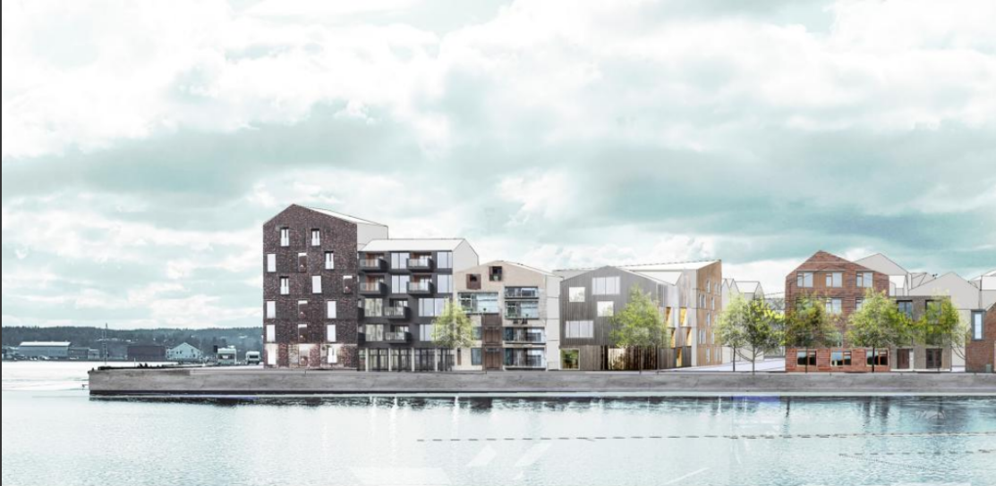
Visionsbild för Kattvikskajen av Landskapslaget.