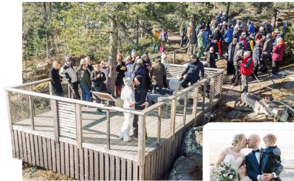
Vigseln hölls på Öjebergets utsiktsplats.