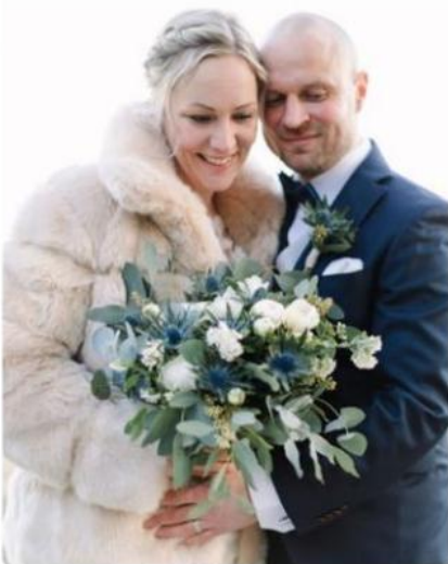
Brudparet beundrar brudbuketten.

Efter det ska brudklänningen på och frisyr och sminkning fixas inför kvällens festligheter.